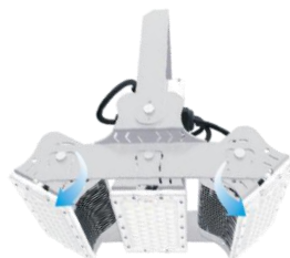
1台ごとの角度調整が可能