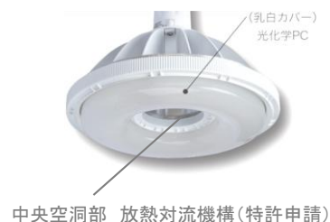
中央空洞部 放熱対流機構(特許申請)