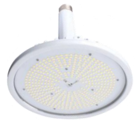
E39タイプ (屋内バラストランプ代替可能)