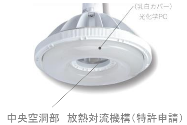
中央空洞部 放熱対流機構(特許申請)