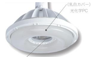
中央空洞部 放熱対流機構(特許申請)